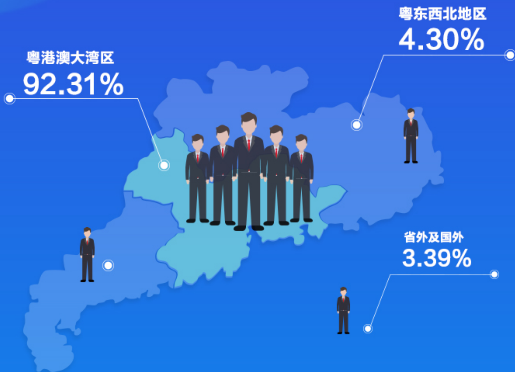
▲ 应届毕业生初次就业区域流向