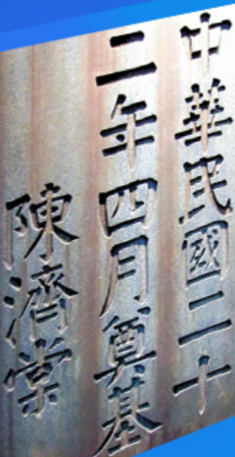
▼ 陈济棠为我校题写奠基石碑