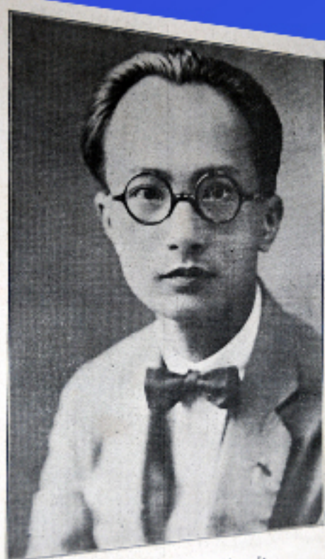
巽 长 校 黄 校 本